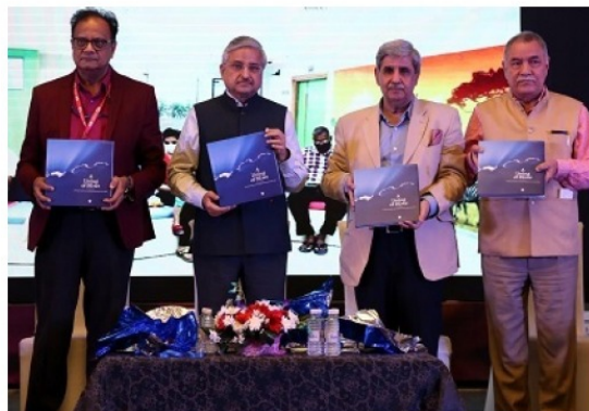
More than 450 delegates participated in the conference