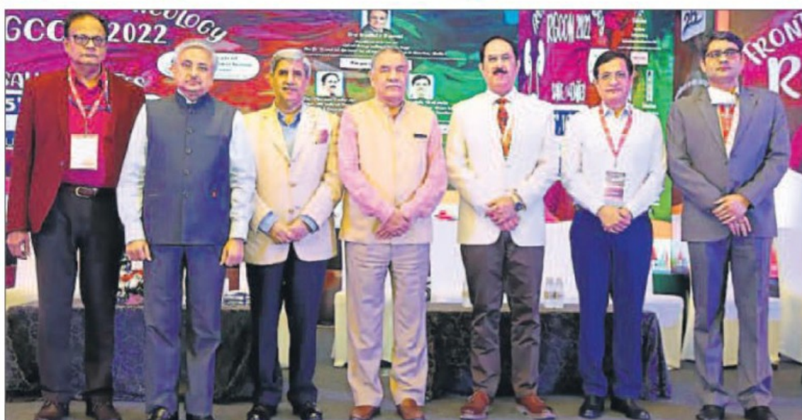
The 20th edition of RGCON was underway recently