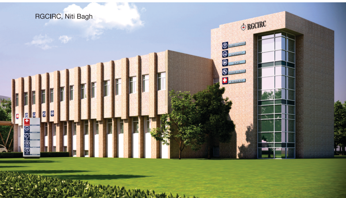
RGCIRC, Niti Bagh

Sector 5, Rohini, Delhi - 110085 Emergency: +91 - 11-4702 2222 Appointment: +91 - 11-4702 2070/71 Email: info@rgcirc.org Website: www.rgcirc.org