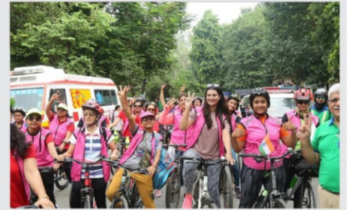
साइकिल रैली में हिस्सा लेती युवतियां।

नई दिल्ली। पैरों, रीढ़ की हड्डी और जोड़ों के दर्द के प्रति जागरूकता के लिए रविवार को मेराथन दौड़ का आयोजन किया गया। इस दौरान लोगों को बताया गया कि यदि आप सप्ताह में 5 दिन रोजाना 30 मिनट टहलते हैं तो हड्डियों के दर्द की समस्या नहीं रहेगी। नियमित चलने से मसल्स और हड्डियों में होने वाले मसक्यूलोस्केलेटल दर्द से आराम मिलेगा। व्यूरो